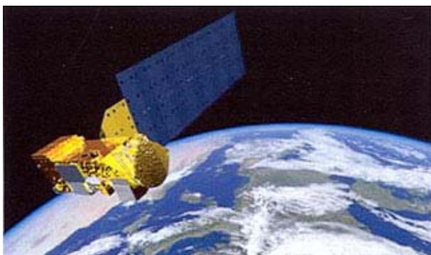
Slika 4. Satelit Aqua, NASA EOS sustav [15]

dovest će do razvoja sofisticiranih modela hidroloških procesa i pripadna unapređenja regionalnih i globalnih klimatskih modela, s direktnim anticipiranjem koristi od preciznijih prognoza vremena i klime [9]. Aqua program NASA, SAD satelitska je misija imenovana po velikom broju informacija te misije o Zemljinom vodnom ciklusu. U monitoring su uključeni: isparavanje s oceana, vodena para u atmosferi, oblaci, oborine, vlažnost tla, snijeg i led te stalni led. Ostale varijable koje opaža satelit su fluksovi radioaktivne energije, aerosoli, biljni pokrov, pojave fitoplanktona i otopljena organska materija u oceanima te temperature zraka, tla i vode. Ova misija je dio NASA međunarodnog sustava Earth observing system (EOS) . Satelit je lansiran u orbitu 5. kolovoza 2002. godine (slika 4.). To je zajednički projekt SAD-a, Japana i Brazila. Ključna su mjerenja određena koncenzusom između znanstvenika cijeloga svijeta [15].