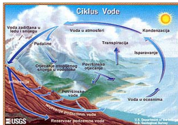
Slika 2. Hidrološki ciklus

sustav, pokretan energijom Sunca i silom težom, stalna je izmjena vlage između oceana, atmosfere i kopna. Istraživanja su pokazala da mora, oceani i ostala vodna tijela (jezera, rijeke) daju približno 90 posto vlage u atmosferi. Tekuća voda napušta te izvore kao rezultat evaporacije, procesa u kojem voda prelazi iz tekućeg u plinovito stanje. Dodatno vrlo male količine vodene pare ulaze u atmosferu sublimacijom. Preostalih 10 posto vlage u atmosferu dolazi od transpiracije biljaka. Evaporacija, sublimacija i transpiracija, plus vulkanske emisije, zajedno daju ukupnu vodenu paru u atmosferi. Isparavanje s površine oceana je primarno u hidrološkom ciklusu.